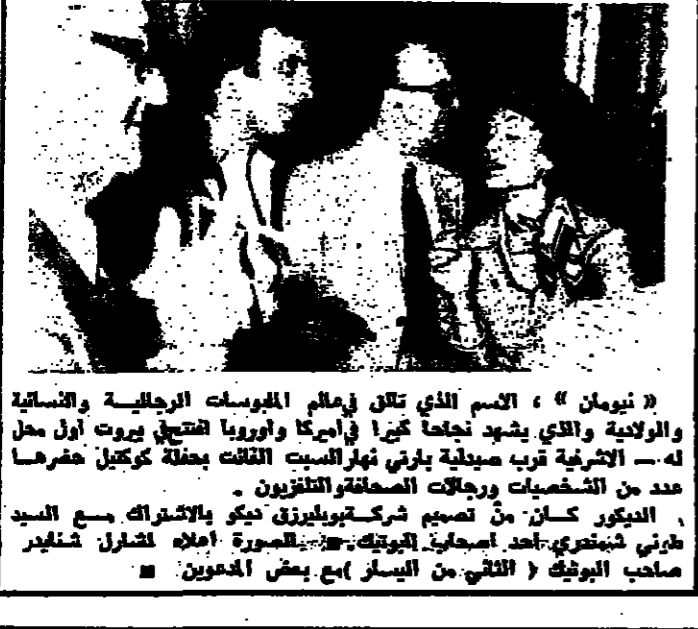
اشاع محل « نيومان » في الشرفه

« نيومان » ، الاسم الذي تطلقه المورسات البريطانية والشعبية والولادية والذي يشهد نجاحا كبيرا في أمريكا وأوروبا الفتح بيروت اول محل له - الاثرية تريب صيدلية برفني نهارالسبت الثالثة بحلة كوتيل حفرها عدد من التخصيمات ورجال الصناعات والتجار . الدكتور كان من تصميم شركة بوليفيا ديكو والاشراك مع السيد طربي شينوري ، احد اصحاب البوتيك - الصورة املا لشارل شخيلر صاحب البوتيك ( الثاني من اليسار ) مع بعض المدعوين .